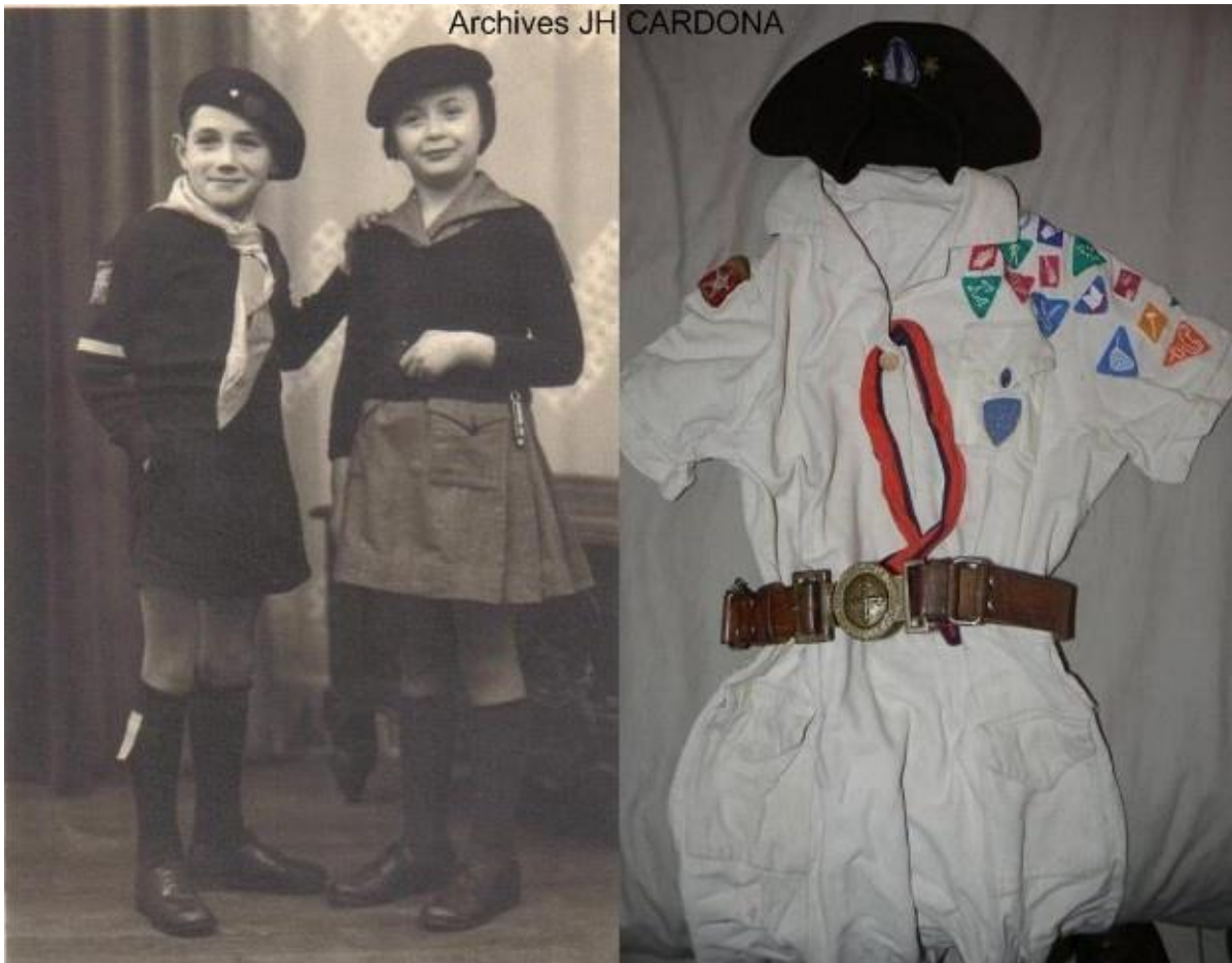
Louveteau et petite aile- Petite Aile FFE Province du Maroc