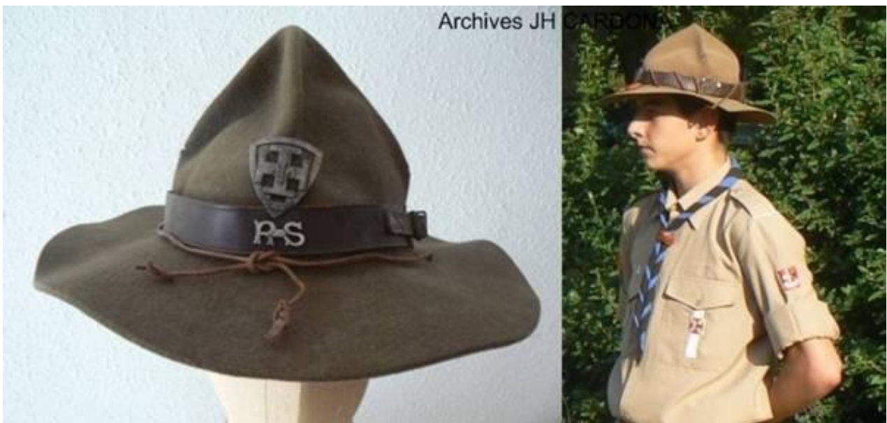
Chapeau de SUF RS – Eclaireur SUF