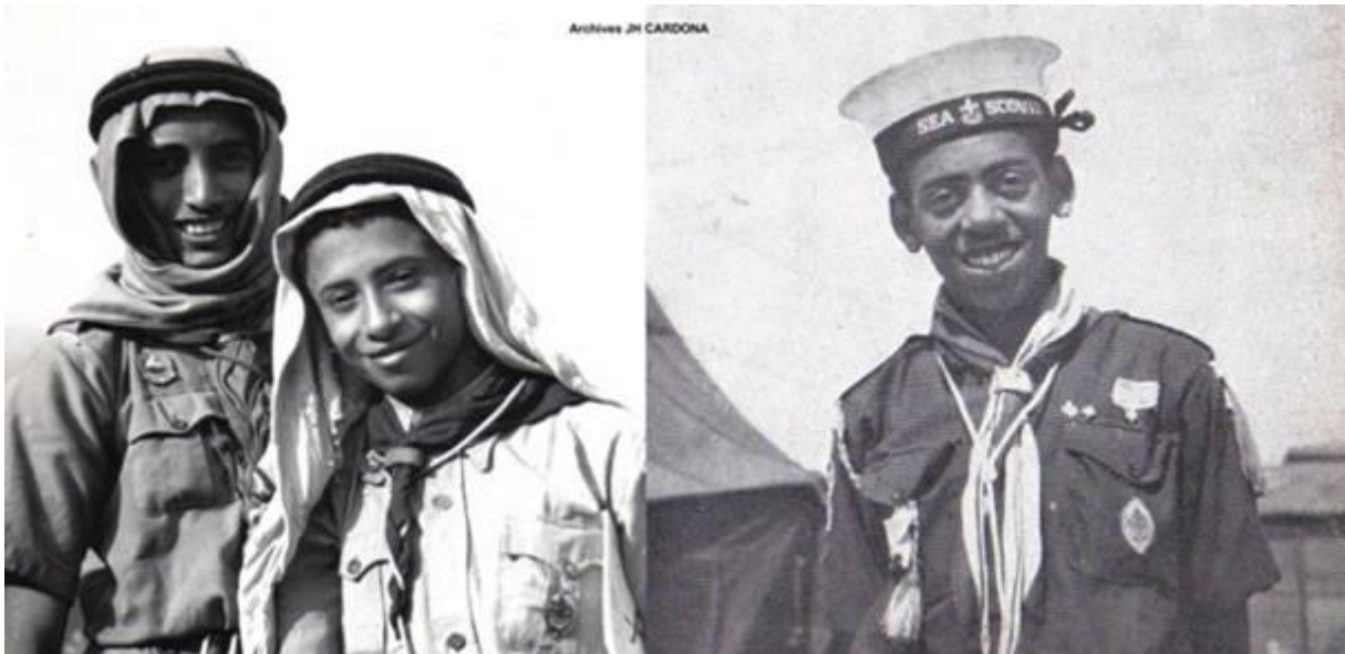
Scouts d'Arabie au JAM-Scout Marin du Commonwealth