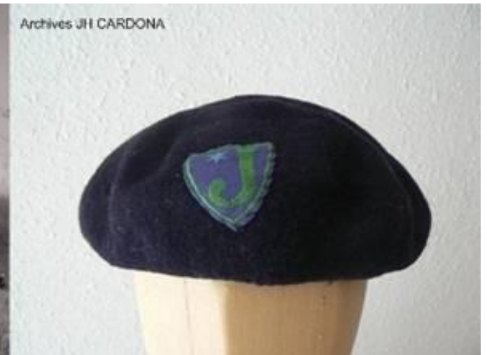
GDF béret fleur bleu de Jeannette