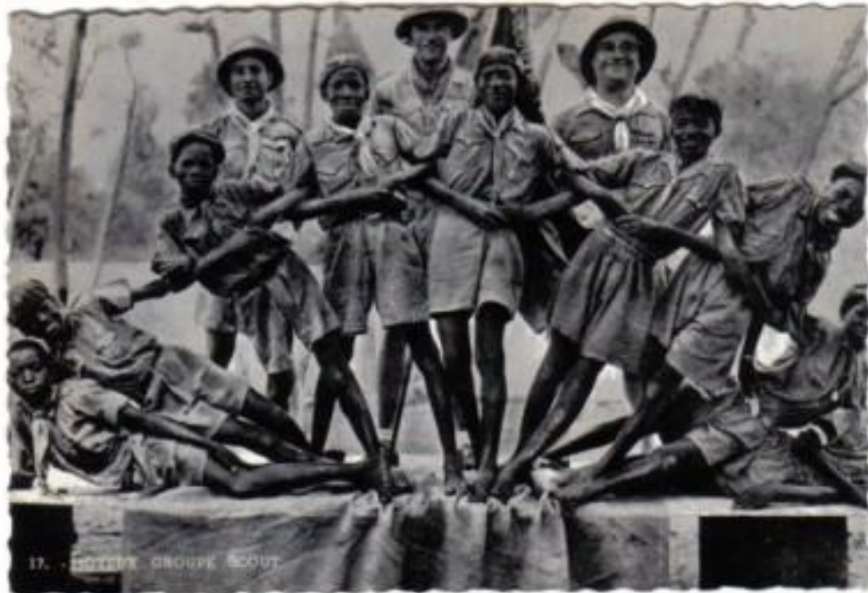
Dessin de Paul BOUDOT- Casque colonial AOF