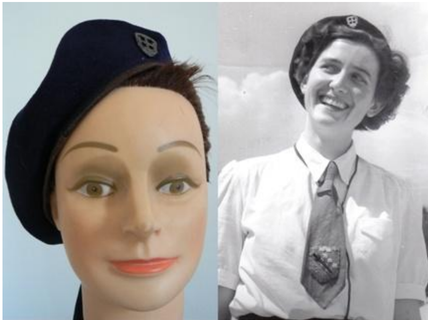
Archives JH CARDONA