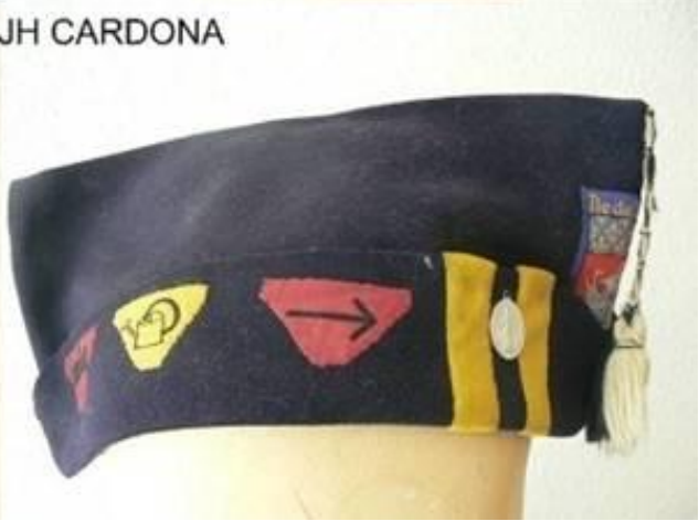
S.D.F - Béret louveteaux 2 étoiles 1950 - béret louveteaux 1930- Calot de jeux