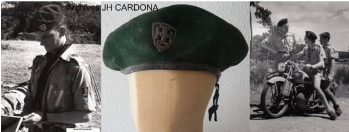
SDF : Beret vert de raider