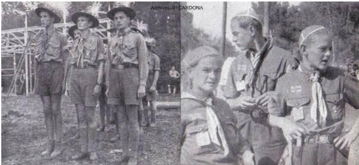
Scouts Hongrois-Scouts Finlandais