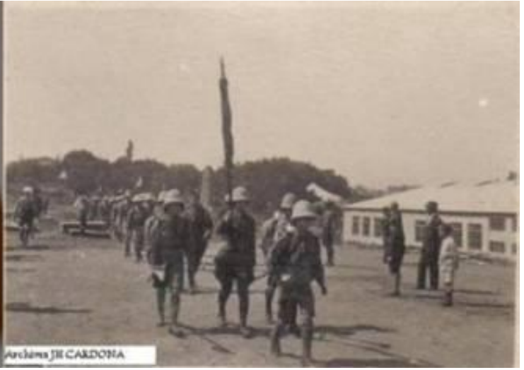
EDF Colonies-Photo EDF section de Constantinople