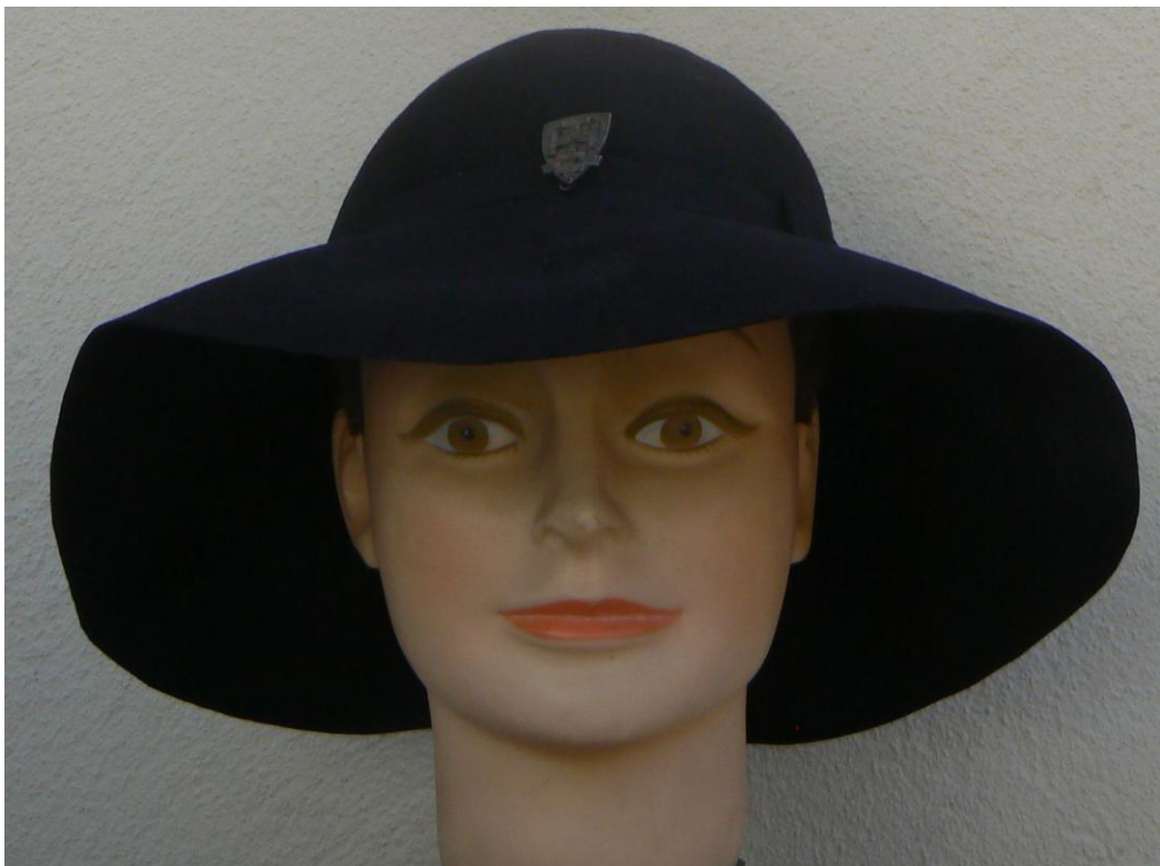
GDF : Chapeau cheftaine après-guerre