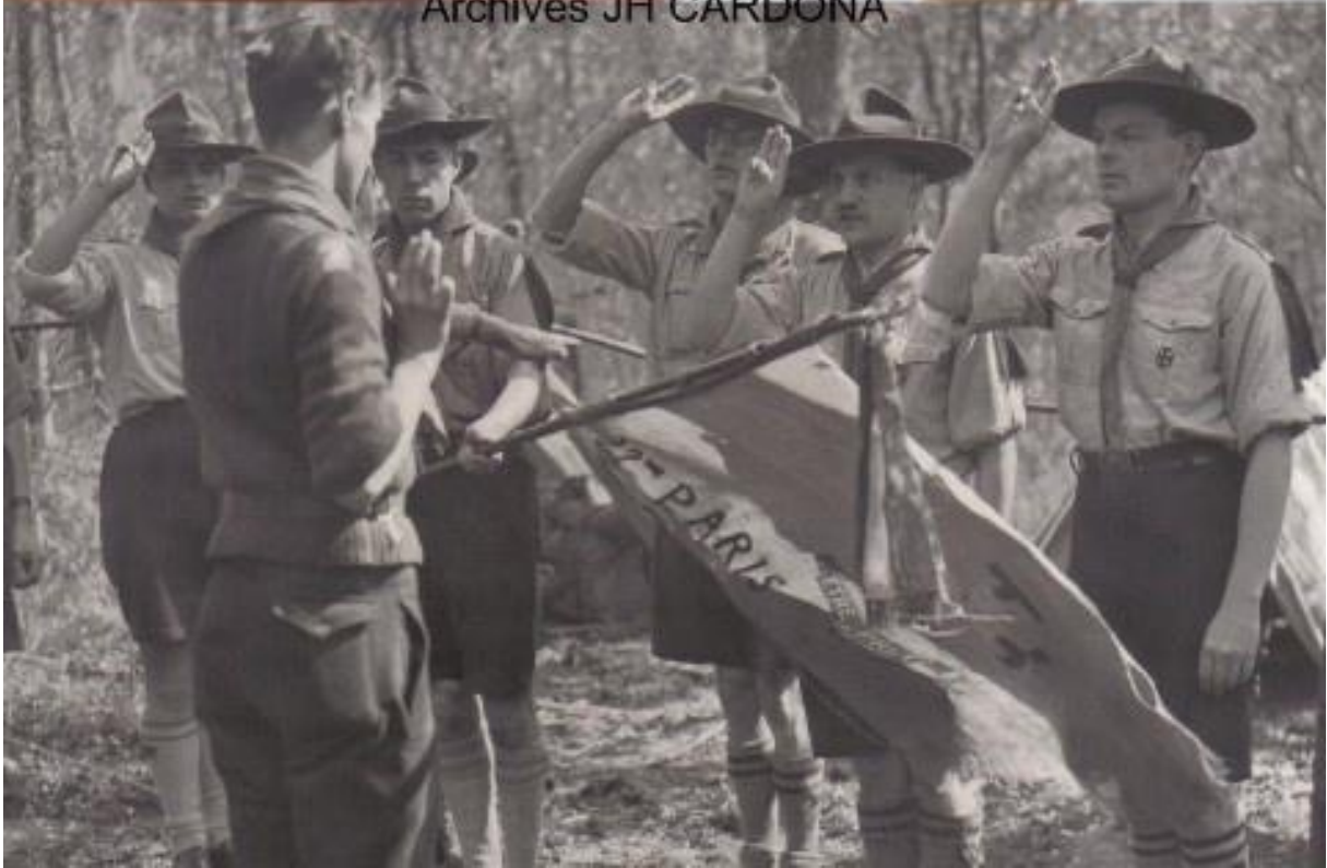
Chapeau SR-Chapeau SDF chef- Photo Routiers SDF 1930-SDF