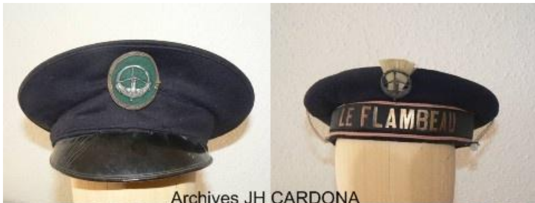
Archives JH CARDONA