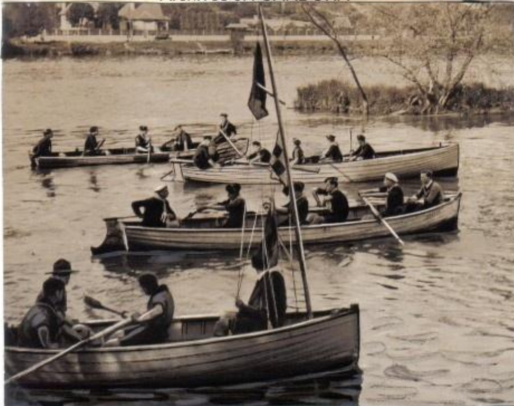
Casquette EDF chef marin 1930- Bachi EDF chef marin