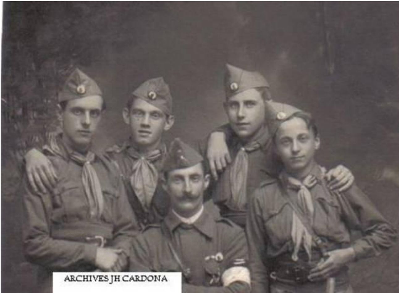
Eclaireurs Français en calot