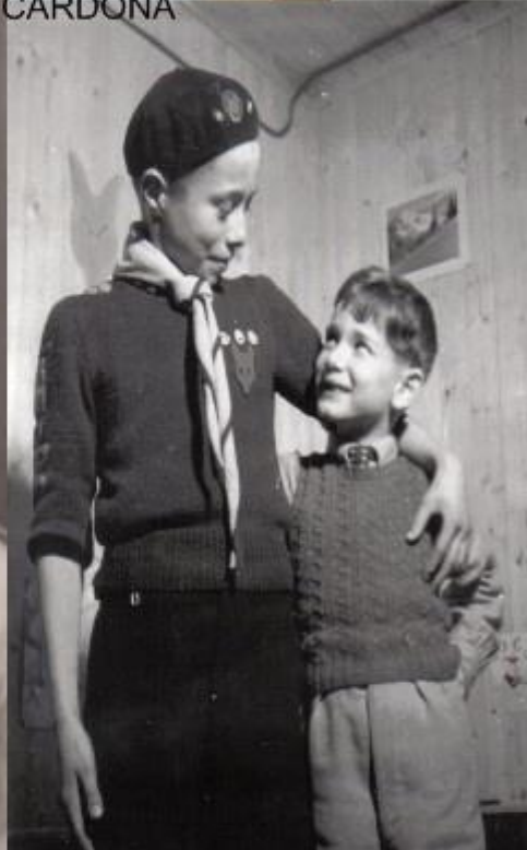
Photo EDF 1930 - Chapeau EDF - EDF 1945 1947 - Louveteau EDF