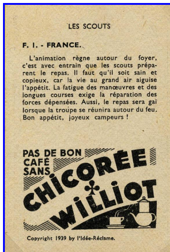
Verso de l'image

PS. Malheureusement, toutes les images rencontrées sont floues.