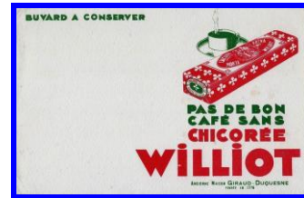
Autres publicités de la marque (Protège-cahier et buvard)